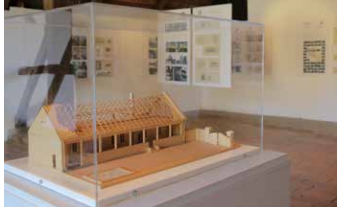
◀ Kiállítás, Szentendre, 2018.

A felmérési munkának így volt egy másik hozadéka is, nevezetesen az, hogy egy időre ráirányították a település figyelmét pusztuló értékeikre, befolyásolva, javítva az ott lakók értékítéletét. Ezt volt hivatott erősíteni a felmérési tervek, rajzokból, fényképekből, makettekkel szervezett kiállítás, melyet a községben lakók megtekinthettek a következő évben, szintén a diákkör jóvoltából. Szabó tanár úr régi vágya volt az épületek utóéletének figyelemmel kísérése, ami csak néhány esetben valósult meg, de egyes településeken sikerült településrendezési problémára házi pályázatot lebonyolítani a diákok közreműködésével. Ezeket a pályázatokat az építészsakma jeles képviselői zsűrizték, és a tervek tanulságait teljes egészében felajánlották a településnek. Ezáltal segítséget nyújtottak a településvezetőknek egy értékmentő, jó gazda gondosságával cselekvő irányítási szemlélet megvalósítására. Az összegyűlt építészeti anyagot a Szentendrei Szabadtéri Néprajzi Múzeum vette át. A tekintélyes mennyiségű felmérési dokumentációk katalogizálása még tart, de bejelentkezés után személyesen kutathatók és megtekinthetők a múzeum archívumában. Ők adtak helyet a Gyökerek és