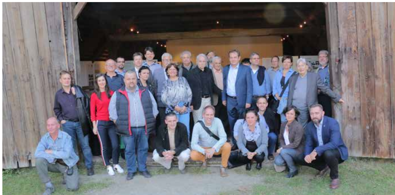
▲ Konferencia és kiállítás, Szentendre, 2018.

vissza, amit én megláttam ott a maga valóságában, de egészen másvalamit, mely lehetett igen érdekes, de számomra idegen volt, sőt értéktelen. Viszont ha a látott objektumról a legprimitívebb vázlatot készítettem magamnak, az a meglátás így mindig, évtizedek múlva is az én személyes élményemet rögzítette meg, azt, amit és ahogyan a szemem a lelkemnek közvetítette volt.” Létezik hát a titok, és létezik a csapda. A legnagyobb mesterek, mint Szabó tanár úr is, tudják ezt, de nem beszélnek róla, csak körülírják, és mosolyognak. A lerajzolt házak, részletek, utcaképek pedig beépülnek az ember gondolkodásába, az a régen rajzolt vonal ott van a most tervezett házak skiccei közt, és így átmentünk valamit egy folyamatosan pusztuló világból a túlpartra. Az NTDK szellemiségét Szabó tanár úr így fogalmazta meg diákjaival Kásonban: „Magyarságtudat, hazaszeretet, szakmaszeretet, felebaráti szeretet; a nemes, igaz cél megértése, alázattal szolgálása; tisztességesen, felkészülten, szerényen, okosan, többet vállalva tartalmas életet élni, a megpróbáltatásokat derűs nyugalommal fogadni, és a nagyon mélyről jövő ősi magyar hangot meghallani...”