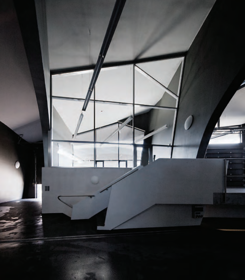
Itt és szemben, lent: Szent Ilona Borászat, Somló, 2012.