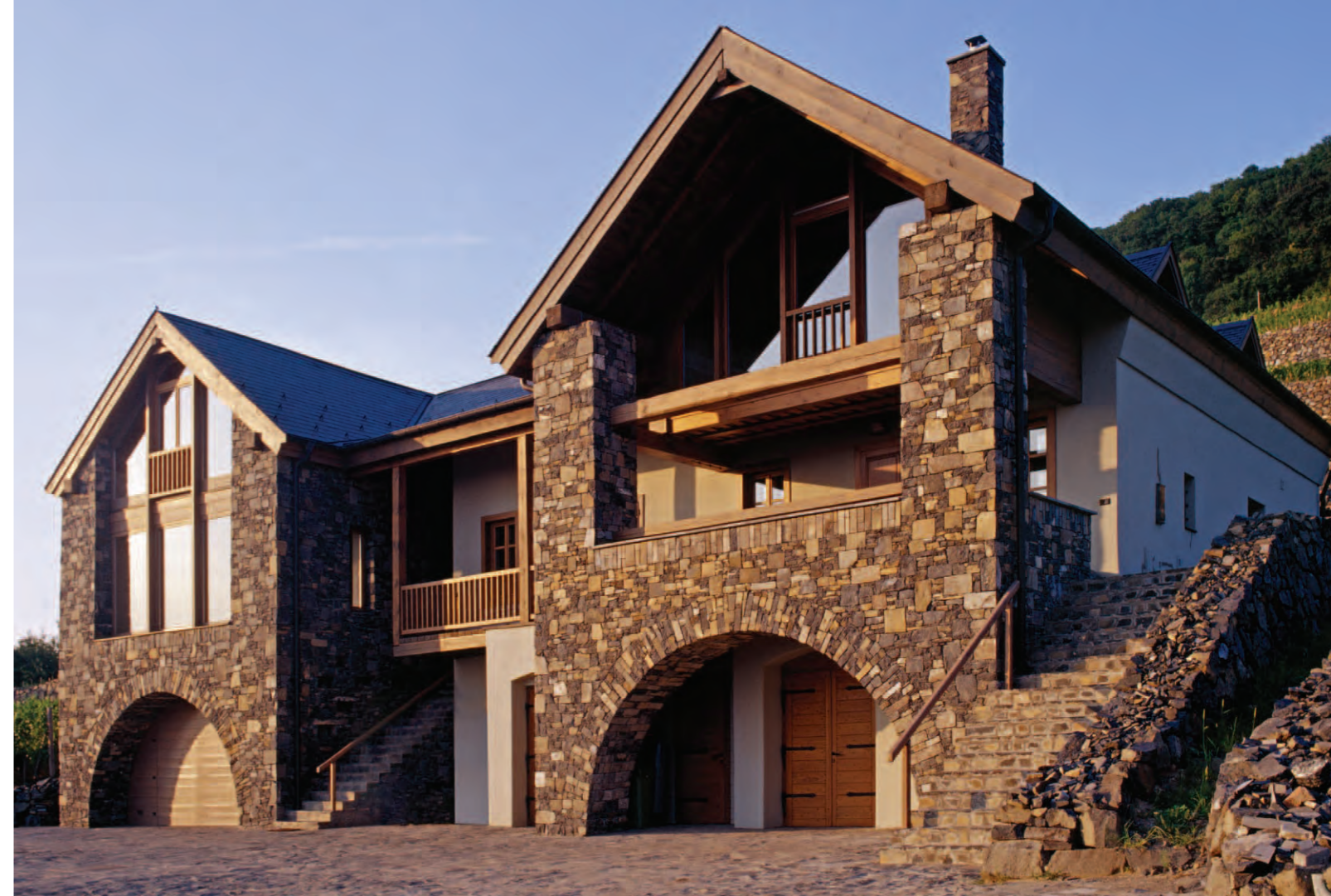
Borászat bővítés, Somló 2006

Jogos az észrevételed. Ezek az épületek ugyanúgy metaforákon alapulnak, mint a korábbi borászatok. A disznókői épület egy dombnak és az abba belefűrődő pinceháznak a nagyított metaforája, ez szervezi a térrendszerét és a megjelenését. Belül mintha pincesoron járnál, kívül mintha egy domb alatt mennél. Metaforikus ötlet adja az egész térbeli és formai rendjét. Somlón hasonló a helyzet, itt az épület tájba illesztése a fontos. A föld alá rejtett nagy csarnok mesterséges dombként fogalmazódik meg,