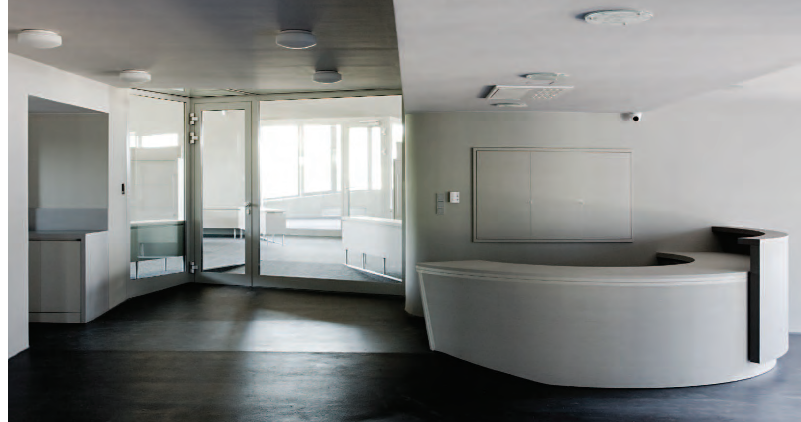
Pezsgőérelő, Somló, 2013.

függően, hogy mennyi és milyen megvilágításra van szükség az adott helyen. Számomra fontos, hogy ne lépj be még a pince rejtett zugaiba sem úgy, hogy ott ne fogadna valamennyi természetes fény.