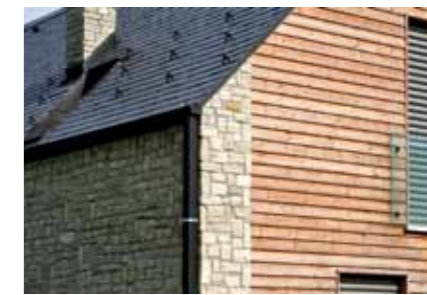
Kis kiülésű ereszt. ▲ logikus és tiszta anyaghasználat

Az építészeti produktumok arányrendszerét elemezve pedig elmondhatjuk, hogy egy jól megkonstruált, nemesen egyszerű vagy gazdagon díszített ereszt az arányok helyreállításában is segít. Az ereszt nélküli dobozépületek, melyeken gyakran az ablakok rendszere is elkent (pl. vonalkódszerű résekből áll, vagy a szintek-