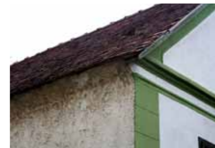
Nemesen egyszerű. ▲ olcsó anyagok és praktikum

A jelenség szimbolikáját elemezve kimondhatjuk, hogy a tetőt teljesen száműző lapos tető „üzene” az, hogy az Ég jóváhagyására és védelmére nem tart igényt, és elég erősnek érzi