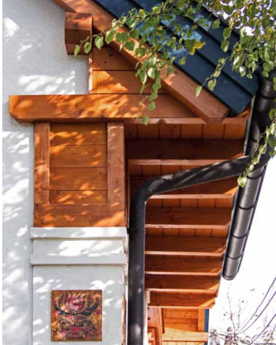
Mozgalmasan drámai. Részletgazdag erőjáték-demonstráció ▲