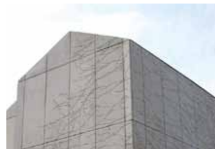
Szofisztikáltan cinikus. ▲ drága anyaghasználattal a formák kiüresítéséért

Hosszú folyamat, amíg érzésekből, köznapi és szakmai nyelven kimondott kritikákból összeáll a kép, és meghatározhatóak valódi irányultságai, okai és céljai egy mára már – az építészsajtónak és a díjosztogatással terelgető szakmai vezetésnek köszönhetően – divattá lett építészeti gesztusnak. Az első ilyen, legszembetűnőbb elem, hogy a mainstream (fősodratú) építészeti irányzatok épületeinél szinte teljesen hiányoznak a tagozatok, a hangsúlyos, árnyékkal kiemelt vízszintes osztások, elsősorban pedig: a kiugró ereszt. A lapos tetős kockák esetében ezt nem is kell külön magyarázni, hiszen a tetőfelépítmény teljes hiánya hozza magával ezt a fordulatot, de a Magyarországon (egyelőre még a józan ész, az évszázados tapasztalat és az építési hagyományok szerint) érvényben lévő legtöbb helyi építési szabályzat előírása szerint kizárólag magas tetővel beépíthető területeken is megjelent az ereszt elkenő építészeti viselkedés. Ez szélsőséges esetekben olyan cinikus épületekben is testet ölthet, ahol a fal és a tető külső borítása is egynemű, mintegy nevetségesen feleslegessé nyilvánítva az erszvonulat, ami csak az „avított” építési előírások miatt megkerülhetetlen. (Kötelező a magas tető? Tessék, itt van egy! Örüljete!) Mivel az erszkinnyulás legprofánabb célja a falfelület védelme és árnyé-