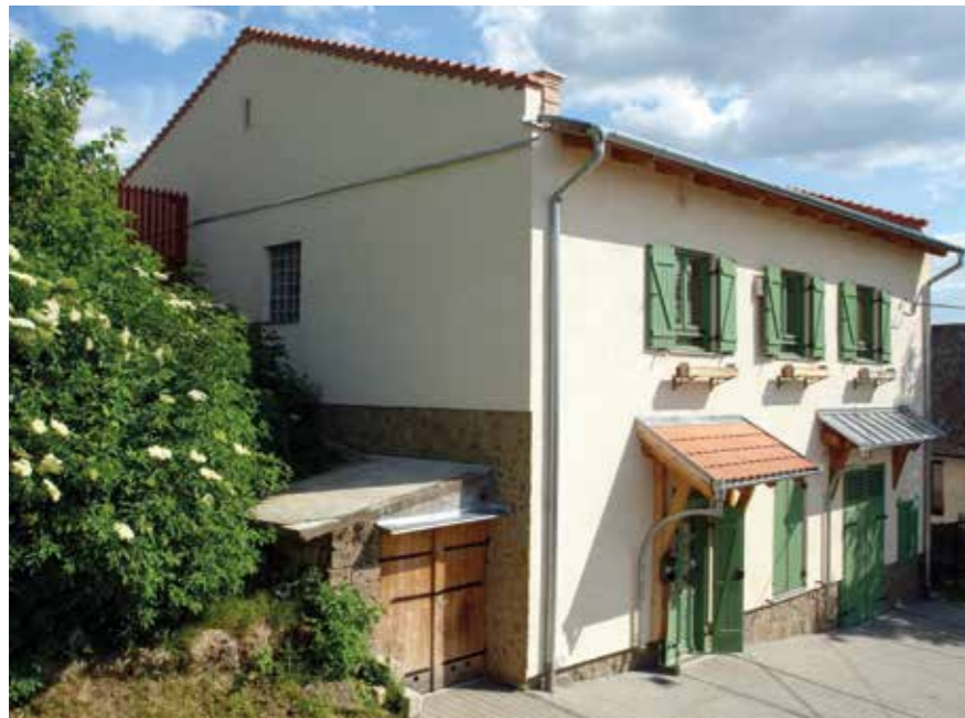
▼ Termelőszövetkezeti préház átalakítása lakóházzá, Budajenő, 2014