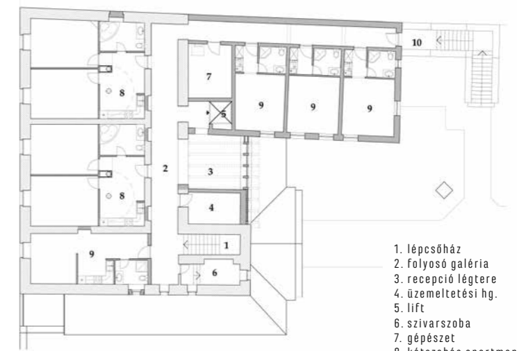
▲ Emeleti alaprajz