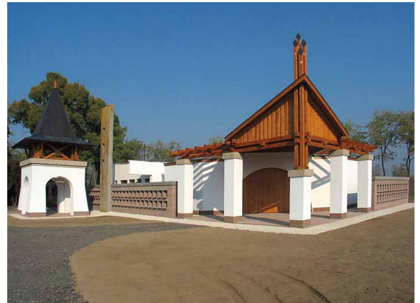
▲ Ravatalozó. Evangélikus Ótemető, Szarvas, 2011

► A vándoriskolai felvételi feladatod 1995-ben a nagymarosi ravatalozó bővítése volt.