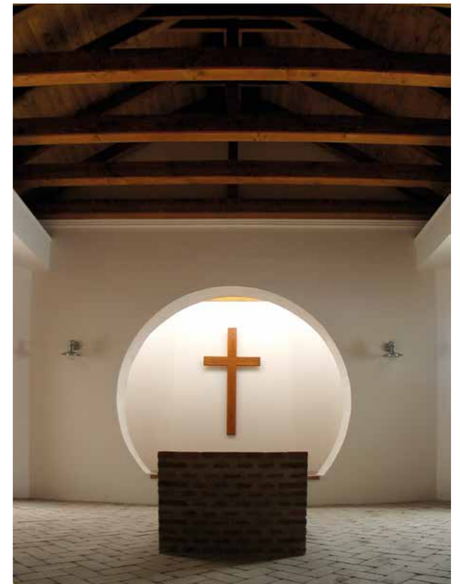
▲ Ravatalozó, Szarvas, 2011

fektetésénél keresgéltem. Az alapvető és hiteles forrás megtalálása után alakítottam ki egy szilárd álláspontot, ahonnan értékelhetőek és megítélhetőek a világban felbukkanó jelenségek. Így lehetett ez annak idején Makovecz Imre, Kampis Miklós és Kálmán István esetében is, akik a 60-as évek kádári rendszerében, egy szellemi-spirituális értelemben légüres térben találtak rá Rudolf Steinerre és az antropozófiára, ami a friss, tiszta hegyi levegő erejével hatott rájuk. Csak egy ilyen szintű fundamentum megléte és megélése esetén