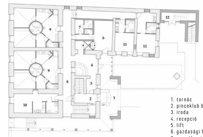
▲ Földszinti alaprajz

tebb oldal- és hátsó homlokzatok között, addig az ereszek egyöntetűen futnak végig a házon, az utcai (díszes) kialakítással. Ez a történetiségben nagyon ritka volt, az utcai eresz mindig kitüntetett szereppel rendelkezett. Az épület felújítása és bővítése örvendetesen jól sikerült. Újabb csatát sikerült megnyerni a vidéki Magyarországot oly sok helyen megbízó enyészet ellen.