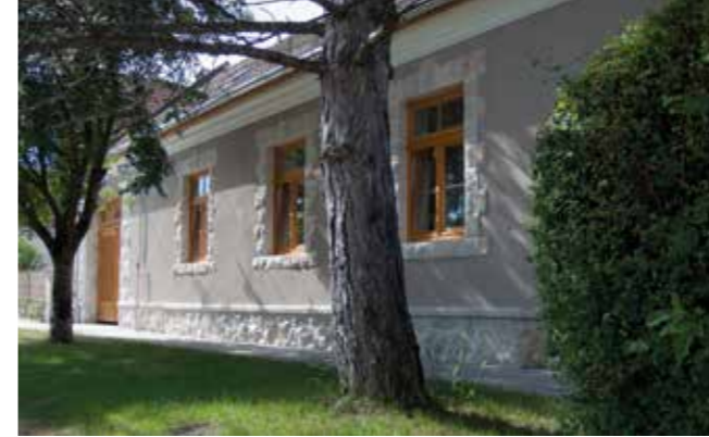
◀ Községi ház, felújítás és bővítés, Budajenő, 2015

illető értékítéletében. Ezt kell felvállalni, és amíg bírja az ember, csinálni. Alpolgármesterként elsősorban a polgármester helyettesítése a feladat, amihez természetesen hozzácsapódik a műszaki beruházások figyelemmel kísérése, koordinálása is, és a szokásos képviselői munka.